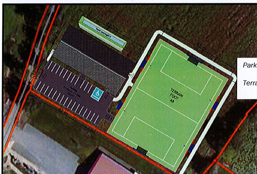
Parking de 25 places

La Société SOLUTECH, le maître d'œuvre, nous a remis une esquisse fin décembre. La solution retenue est un bâtiment traditionnel en dur (panneaux sandwich isolés).