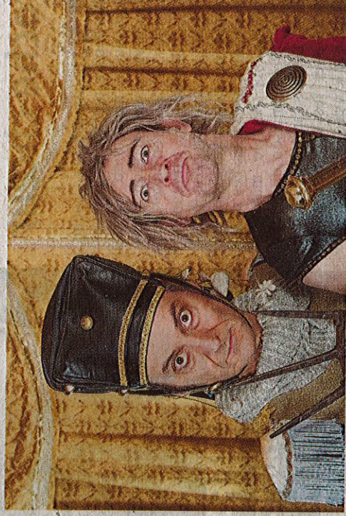
Le duo de clowns Les Mythos jouera six fois en Gâtine.

La fin de semaine sera décidément très riche pour l'association Ah ? : Après un premier acte réussi fin août, le festival revient pour une deuxième séquence riche en propositions. Une dizaine de spectacles seront programmés. Parmi eux, la création circassienne et clownesque Les Mythos , qui sillonnera la Gâtine pour six représentations : jeudi 16 à 17 h, au city-stade de Saint-Loup-Lamairé ; vendredi 17 à 19 h, à l'extérieur de l'espace multi-activités de Saint-Pardoux-Soutiers ; samedi 18 à 11 h, au jardin des Cordeliers à Parthenay, et à 18 h 30, au Jardin des sens aux Châteliers ; dimanche 19, à 17 h, à l'espace de verdure à La Chapelle-Bertrand ; et enfin, lundi 20, à 18 h 30, sur le parvis de l'église à Saint-Aubin-le-Cloud.