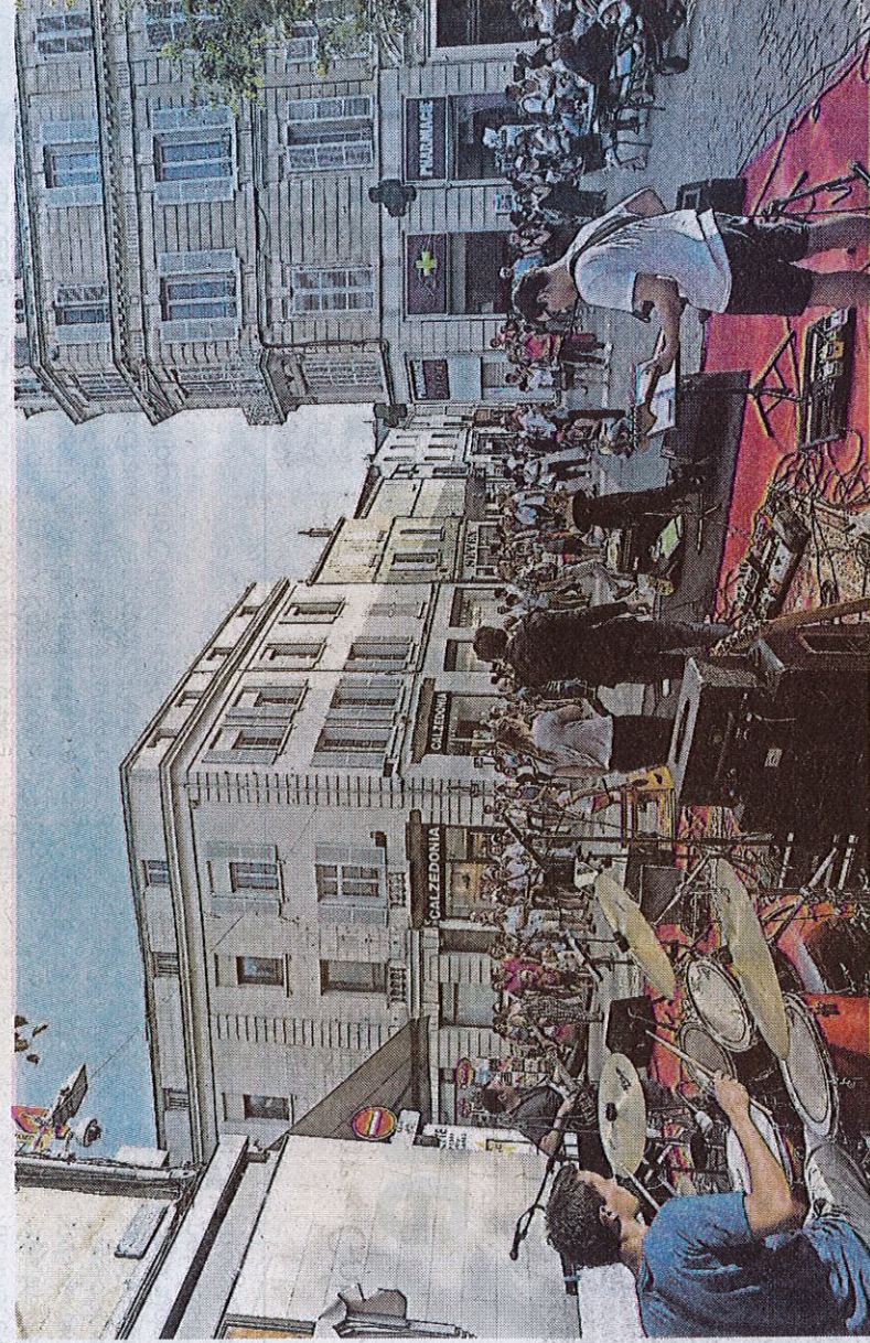
La musique va de nouveau faire battre le cœur de Niort ce mardi soir pour la 41 e Fête de la musique.