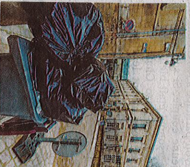
La facture peut être très disparate selon l'endroit où l'on réside.

Taxe incitative. Il y a une part fixe (base locative multipliée par un taux de 10 % à 10,5 en 2023) et une part variable en fonction du nombre de fois où les gens présentent leurs poubelles. Ceux qui ont un bac individuel (40 % des habitants) payent : 3,30 € par présentation de bac de 120 l ; 4,95 € pour un 180 l ; 6,6 € pour un 240 l... (tarifs 2023). En bacs collectifs (avec contrôle d'accès individuel), comptez 1,38 € chaque dépôt de sac de maxi 50 litres ; 2,2 € pour un de 80 l... Par exemple, pour une maison de base locative 1.400, un couple présentant son bac de 120 l une fois par mois paiera pour un 186 € ; une famille paiera douze bacs de 240 l paiera 226 €. Si le couple est en bacs collectifs et