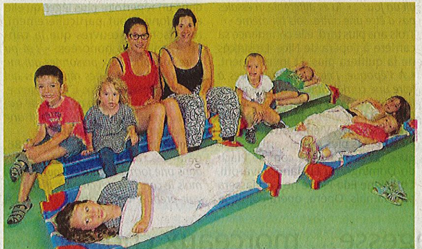
Les petits Zou'loups et leurs deux animatrices, prêts pour cette première nuitée.

dormaient ici, c'est-à-dire au centre de loisirs Les Zou'loups. A l'instar des grands (six à 12 ans) auxquels il est proposé des camps à la Raimondière ou à la Bourrelière, cette année, le centre de loisirs