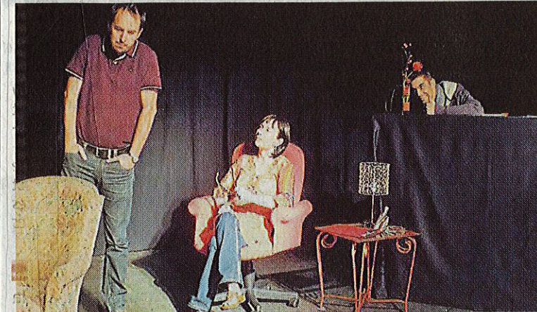
Vendredi, samedi et dimanche, trois occasions de voir la pièce.