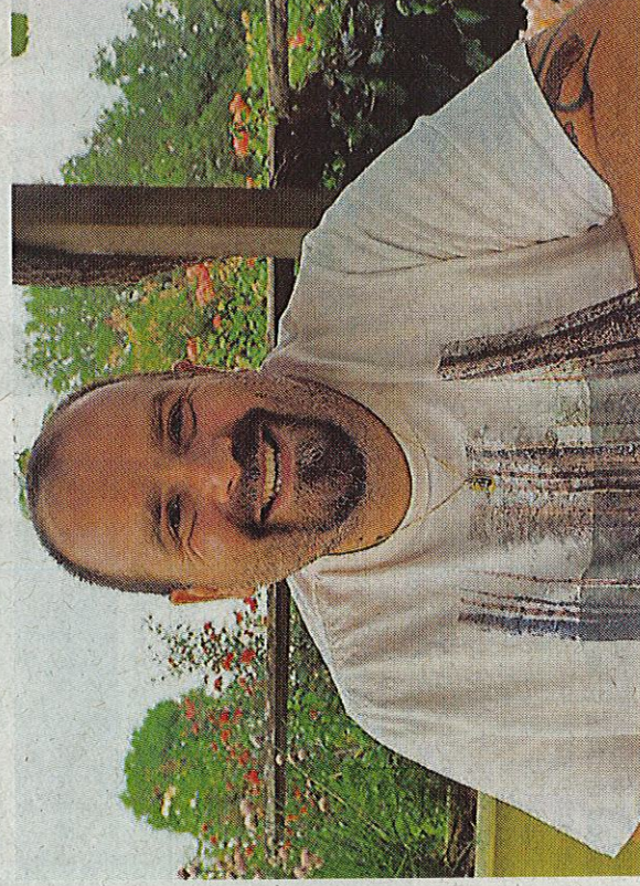
« La Fontaine est une référence en matière de fables, j'ai simplement repris sa méthode d'évoquer la nature humaine en mettant en scène des animaux. »

Localement à Thouars, en me contactant sur mon adresse mail. On ne nous laisse pas la possibilité d'être dans les rayonnages, les gens achèteraient peut-être au feeling, si nous étions visibles. »