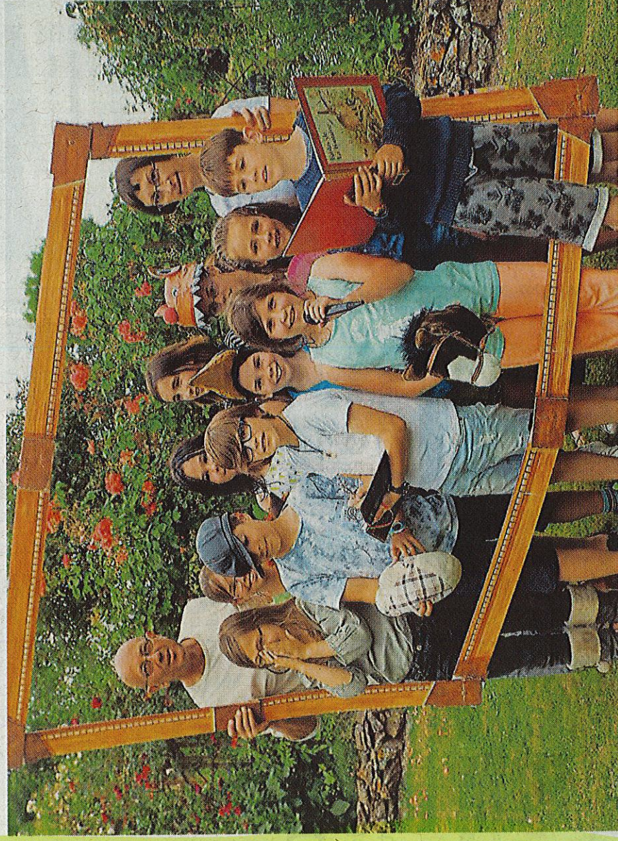
Pour mieux comprendre les fables, les enfants ont décidé d'entrer dans l'univers de Jean de La Fontaine.

Pour sa première sur scène, l'atelier de la Roulotte jouera des fables, samedi.