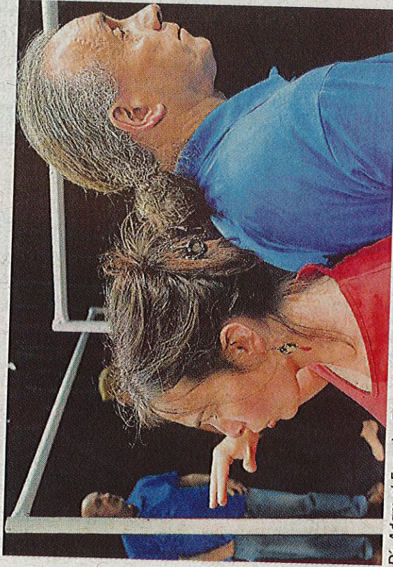
D'« Adam et Eve » à « Elle et lui » ou à « Toi et moi », héros et amour bégaient, la bagatelle le dispute à la buvette.

« On n'a pas su Bordel ! » texte de Léonore Confino, mis en scène par Claude Lалу. Déconseillé aux oreilles chastes et couples fragiles ! Vendredi, à 20 h 30, à La Grange à Robert, à la Garde de Saint-Pardoux. Tarifs : 10 € ; adhérent, 8 €. Réservations au 05 49 94 66 71 ; 05 49 63 43 08. Un gâteau apporté, pourra être partagé.