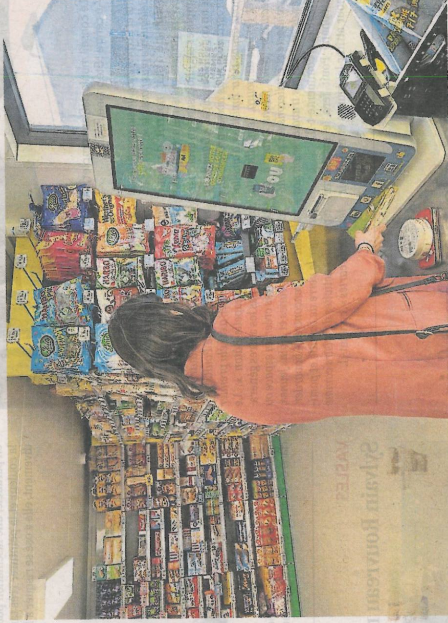
Pas de caissier pour encaisser les clients, qui sont autonomes au moment du paiement.