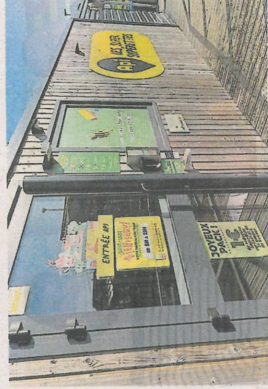
Entrer dans les supérettes API nécessite d'avoir téléchargé l'application sur son téléphone ou de détenir une carte magnétique.